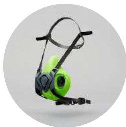
Media máscara BLS 4000 Next S