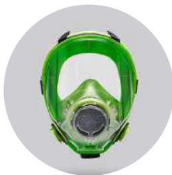
Máscaras BLS 5700