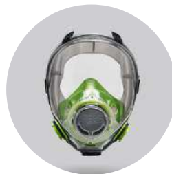
Máscaras BLS 5600