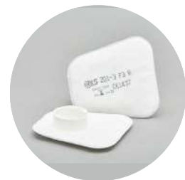
Filtros planos serie BLS 201