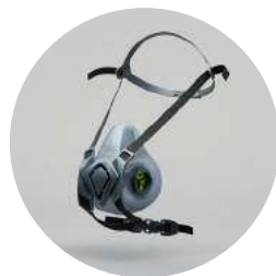
Media máscara BLS 4000 Next R