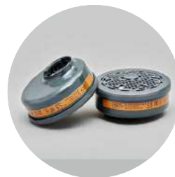
Filtros serie BLS 200